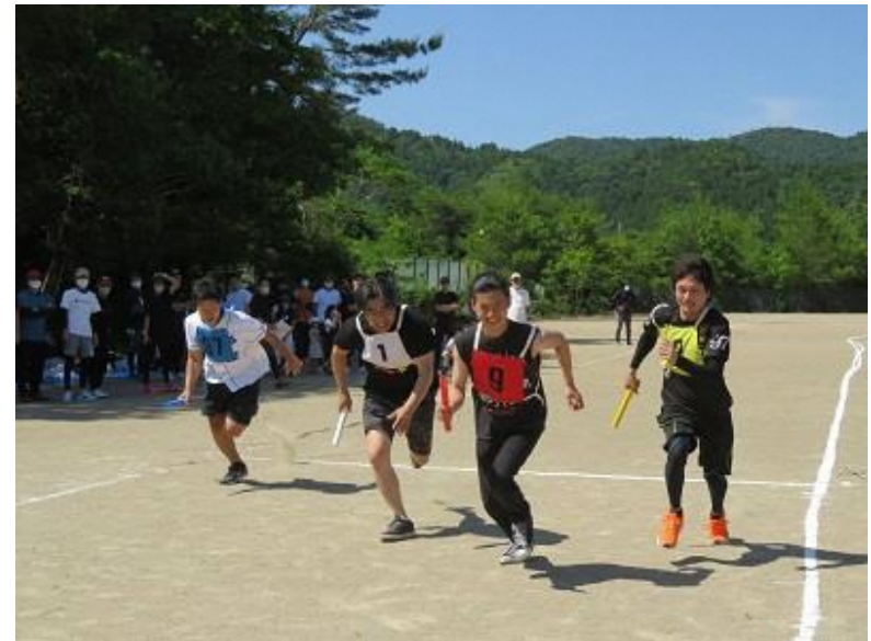
社内スポーツフェスティバル最終種目リレーのスタート

また社員旅行、社内運動会、社員決起大会など社員の交流の場も多くあり、アットホームな雰囲気づくりを心がけています。